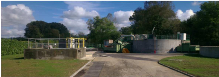
Le respect l'environnement a un coût...

En 2019, cette participation s'élève à 1 567,50 €/logement .