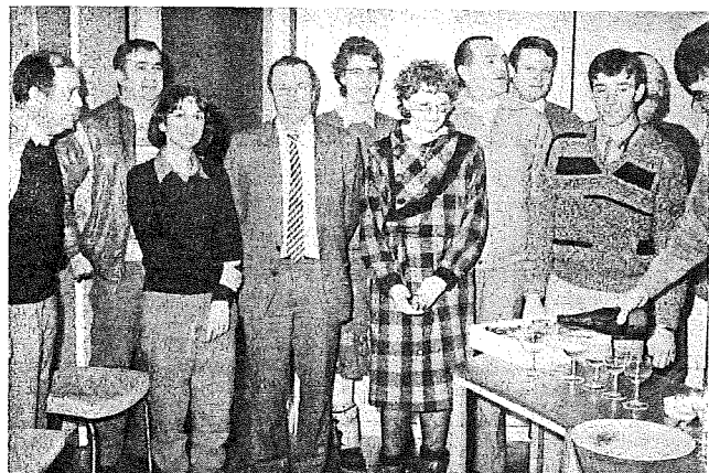
Une sympathique réunion dans les bureaux du syndicat ou selon la tradition les délégués et le personnel se réunissent pour marquer la nouvelle année.

Nombre d'abonnés en 1986 : 4 705 Volume d'eau facturé : 939 965 m 3 Consommation journalière : 3 000 à 5 000 m 3 Montant du budget : 6 099 827 F Canalisations globales : 100 km Nombre de personnes au S.I.E.R.A. : 7